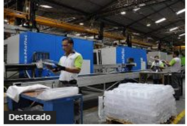
Destacado Economía colombiana bajó 7,6% entre febrero y abril: NowCast Bancolombia