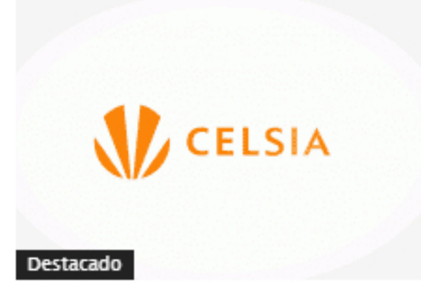
Destacado Celsia difiere algunas inversiones por coronavirus; ve recuperación en demanda de energía