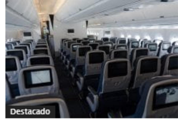
Destacado Colombia no abrirá vuelos en municipios sin Covid-19; prepara ayuda para aerolíneas