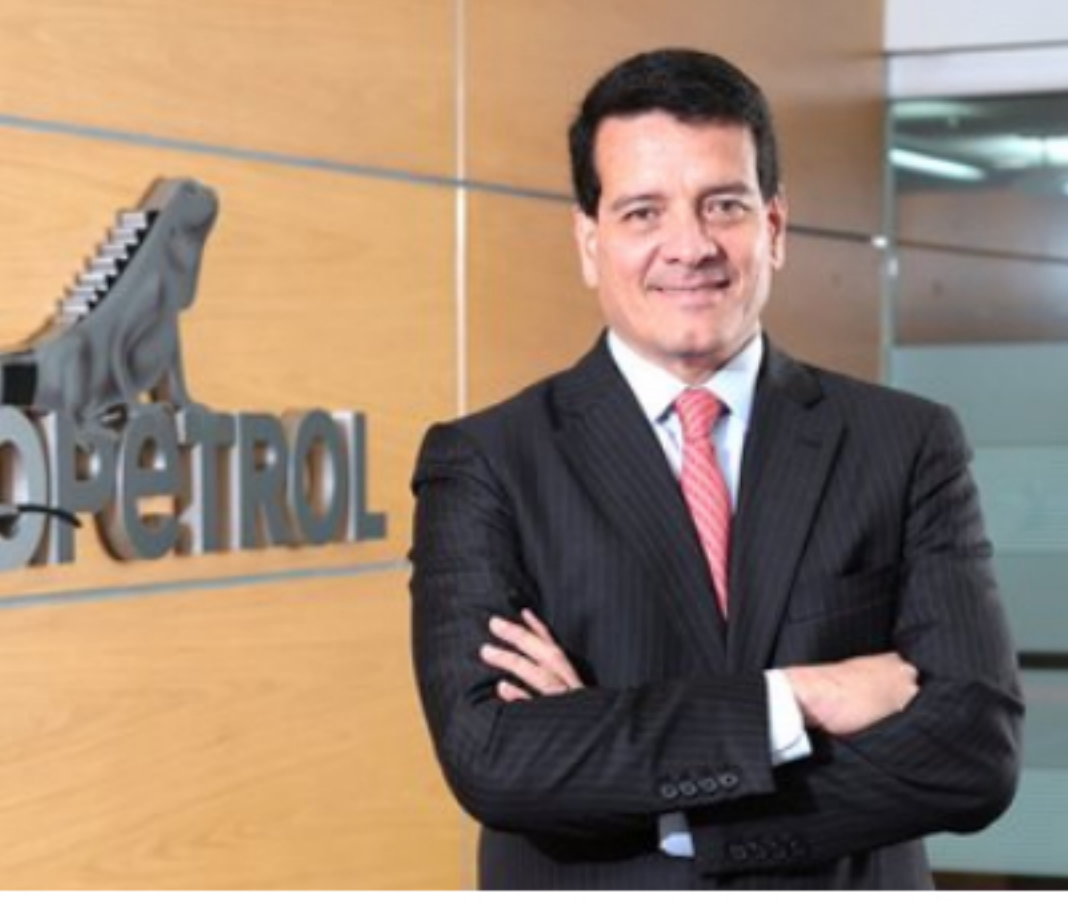
Felipe Bayón presidente Ecopetrol

Por su parte, el Presidente de #Ecopetrol, Felipe Bayón, afirmó que "esta alianza es una muestra positiva de cómo empresas con enfoques distintos pueden unirse, sumar esfuerzos y trabajar de la mano para entregar un producto vital para la protección de los profesionales de la salud que están entregando todo por salvar vidas y atender de la mejor manera a los pacientes afectados por el virus. Hoy exaltamos su labor y seguiremos apoyándolos para que cuenten con los elementos de protección necesarios. Tenemos que cuidar a estos héroes que nos cuidan a todos los colombianos".