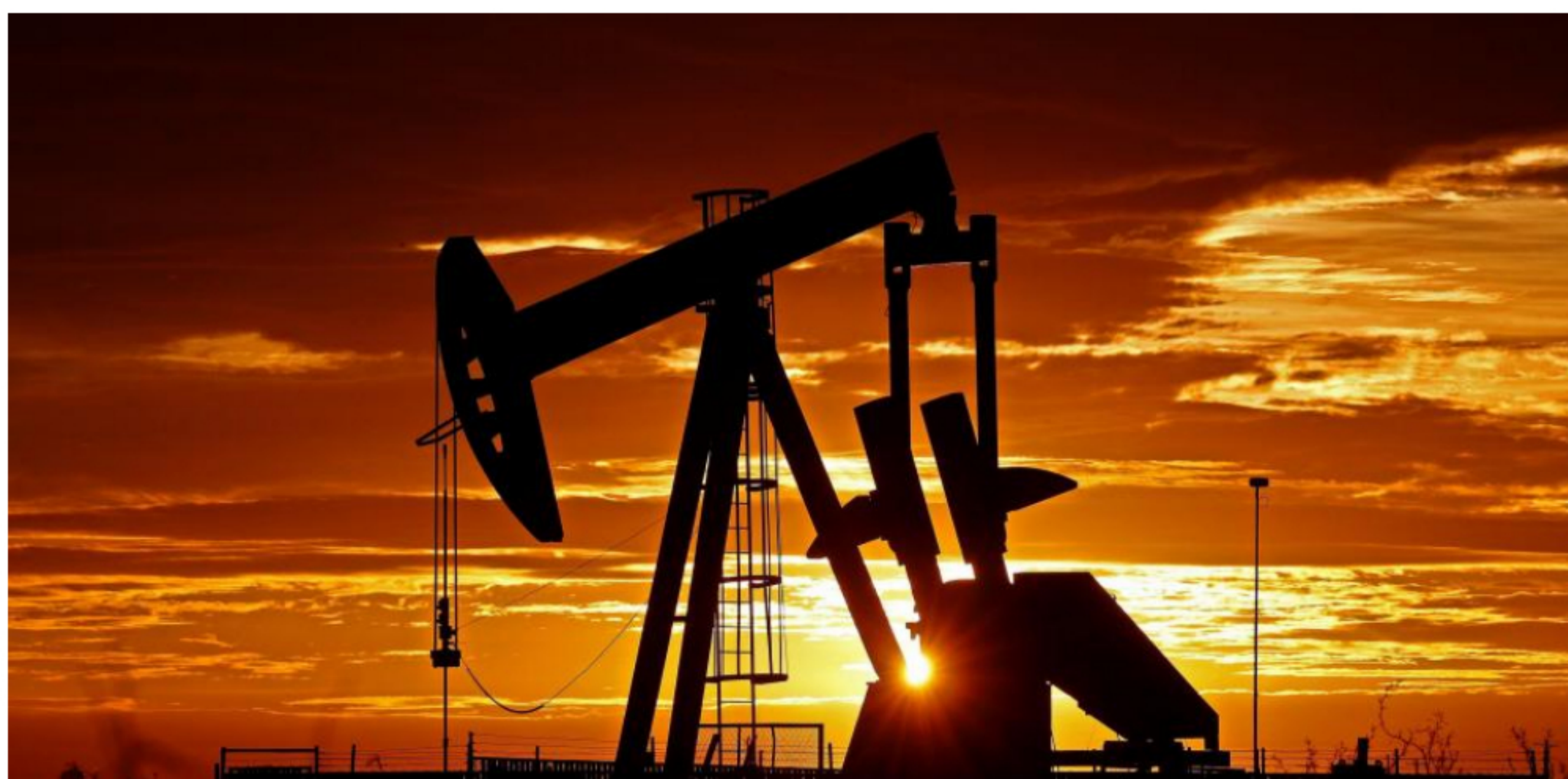
Ante la inviabilidad de opciones por costos, las empresas seguirán reduciendo su producción.

RELACIONADOS: PETRÓLEO | FINANZAS | CUARENTENA