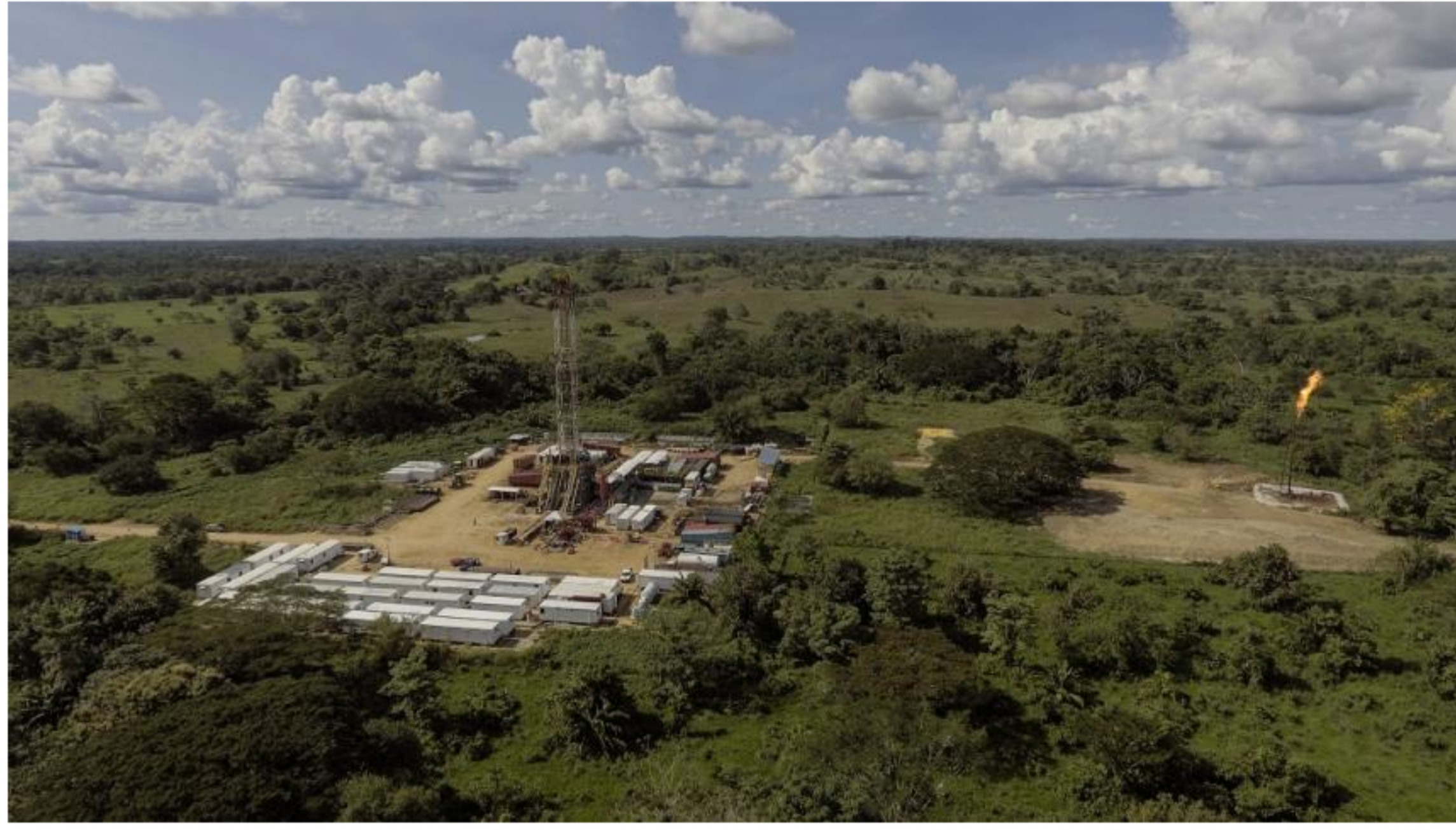
Pozo Arrecife de Hocol ubicado en Córdoba. Archivo