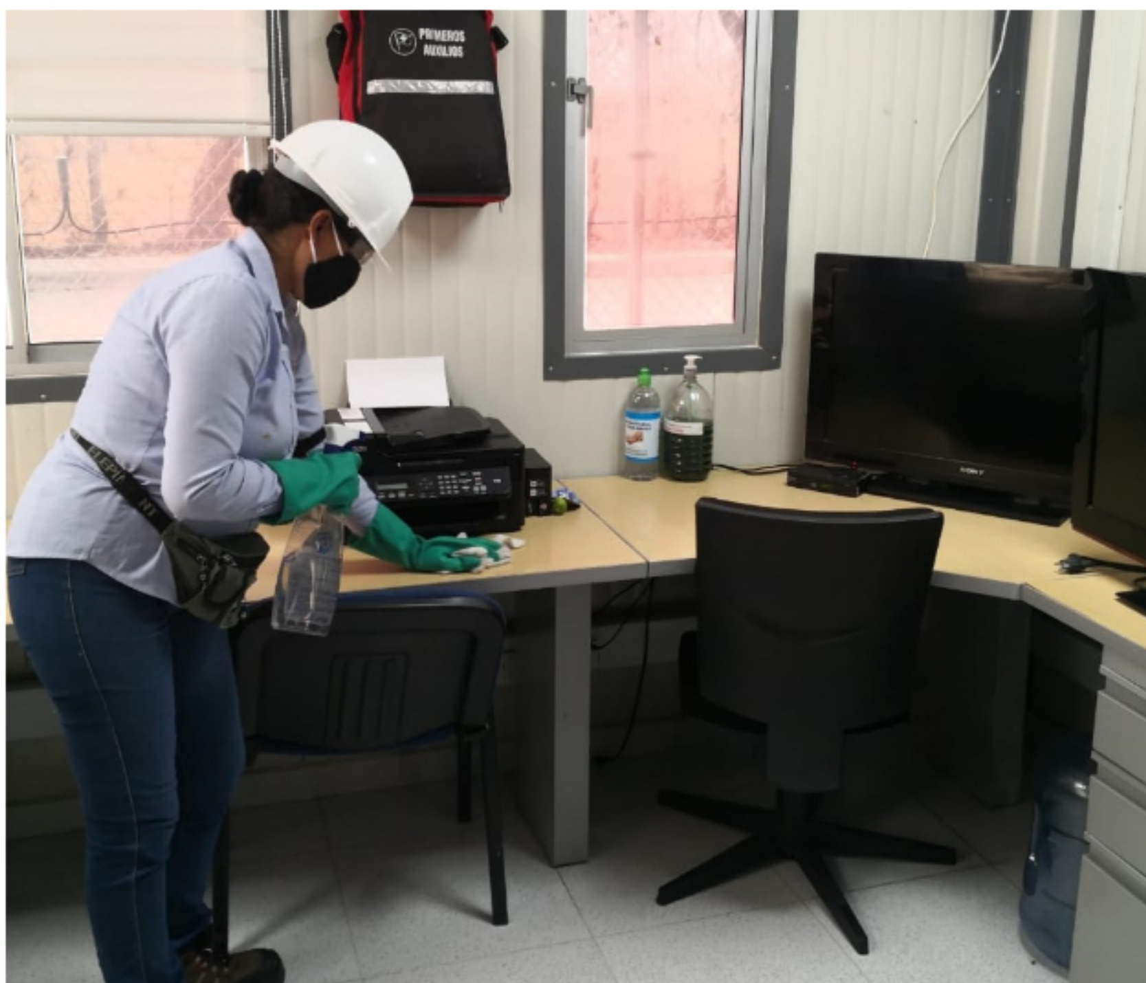
Se aplican medidas de distanciamiento social entre los trabajadores de más de 1,5 m.

Los cambios de turno se realizan amparados en el decreto 593 del 24 de abril de 2020 de la Presidencia de la Republica. En el artículo 3 enumera las excepciones que permite el derecho de circulación de las personas, que para el caso de nuestras operaciones, nos exceptúa en el numeral 28 para el personal que desarrolla actividades de la cadena logística de hidrocarburos y el numeral 33 para el personal de operación y mantenimiento indispensable en plantas industriales del sector público privado.