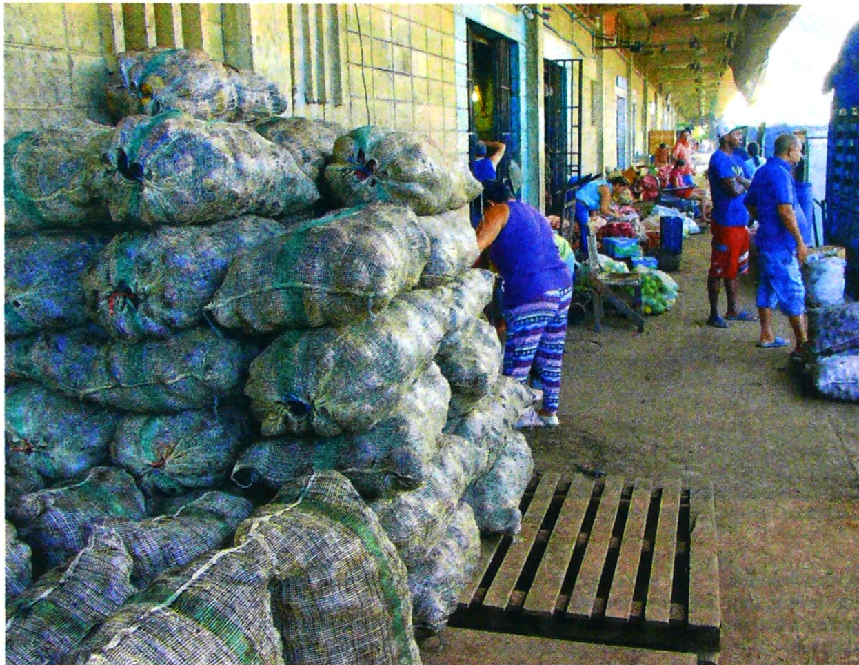
Desde un Centro Logístico coordinado por el Gobierno se garantizará el abastecimiento de bienes básicos.