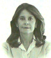
Medidas ante el desafío

En medio de la incertidumbre hay titulares tan negativos que podrían impactar de igual manera la confianza de los inversionistas, amenazando el empleo de los colombianos. Partiendo del respeto a todas las opiniones, incluso las voces más críticas, necesitamos que no exacerbemos el temor de la gente y ayuden generosamente para emprender acciones adecuadas que permitan afrontar esta coyuntura y conservar el positivismo y la confianza de ciudadanos e inversionistas.