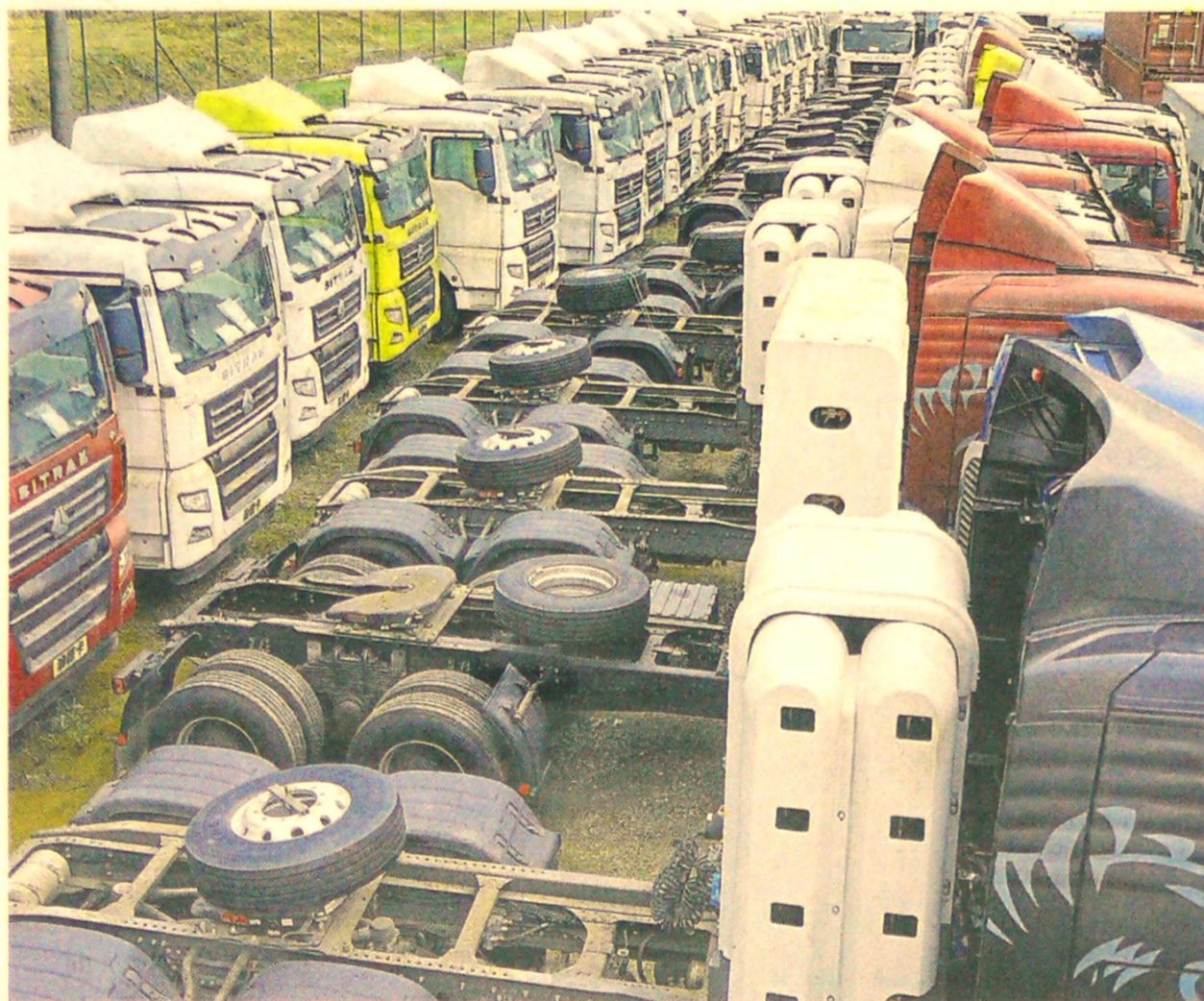
Imagen de la semana

Por demoras en algunos trámites, como la exclusión del IVA, que están tardando hasta seis meses, cerca de 200 camiones que funcionan con gas y electricidad llevan un mes parqueados en los puertos de Buenaventura y Cartagena, así como en zonas francas, a la espera de su legalización.