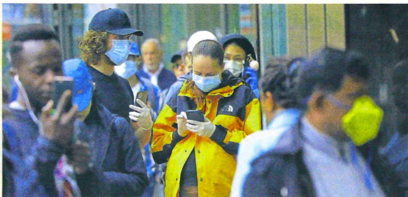
Los ciudadanos han acatado las medidas dispuestas por las autoridades de salud, en todo el país.