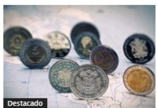
Real brasileño y pesos mexicano y colombiano, monedas que más se han desvalorizado en 2020