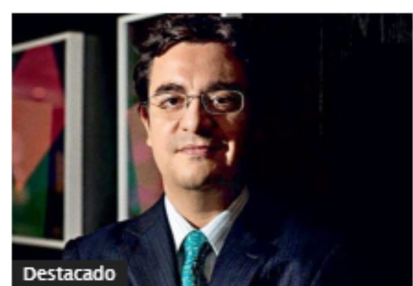
Compensación del IVA costará $1,5 billones al 2022; ingreso solidario vale $600.000 millones