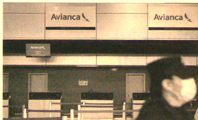
La operación internacional se suspende hasta mayo.

Según la firma, la operación doméstica incluirá atención desde Bogotá de