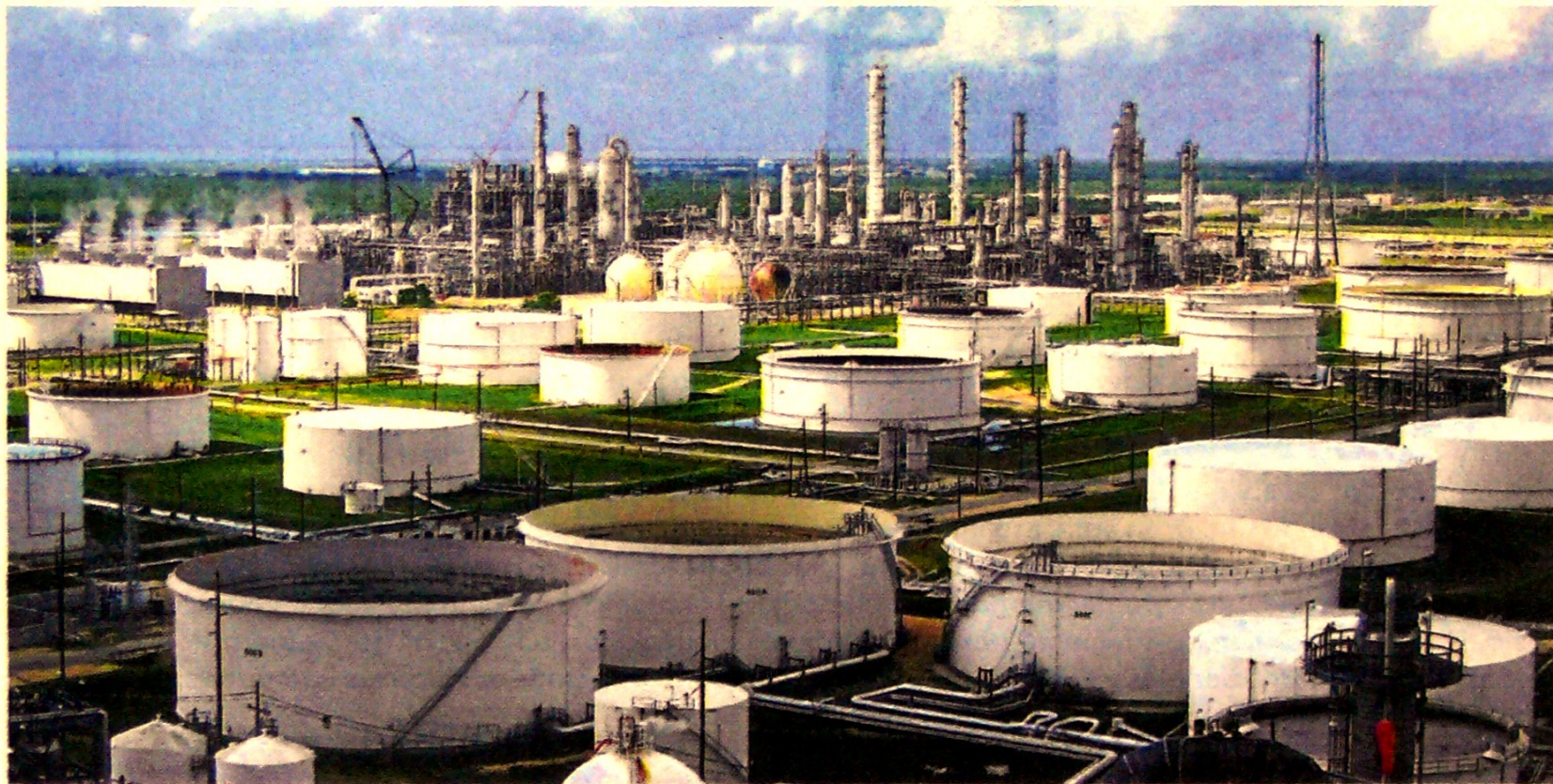
De acuerdo al Ministerio de Minas y Energía, los puntos de almacenamiento cuentan con 270.000 barriles de gasolina motor corriente y 280.000 de diésel.