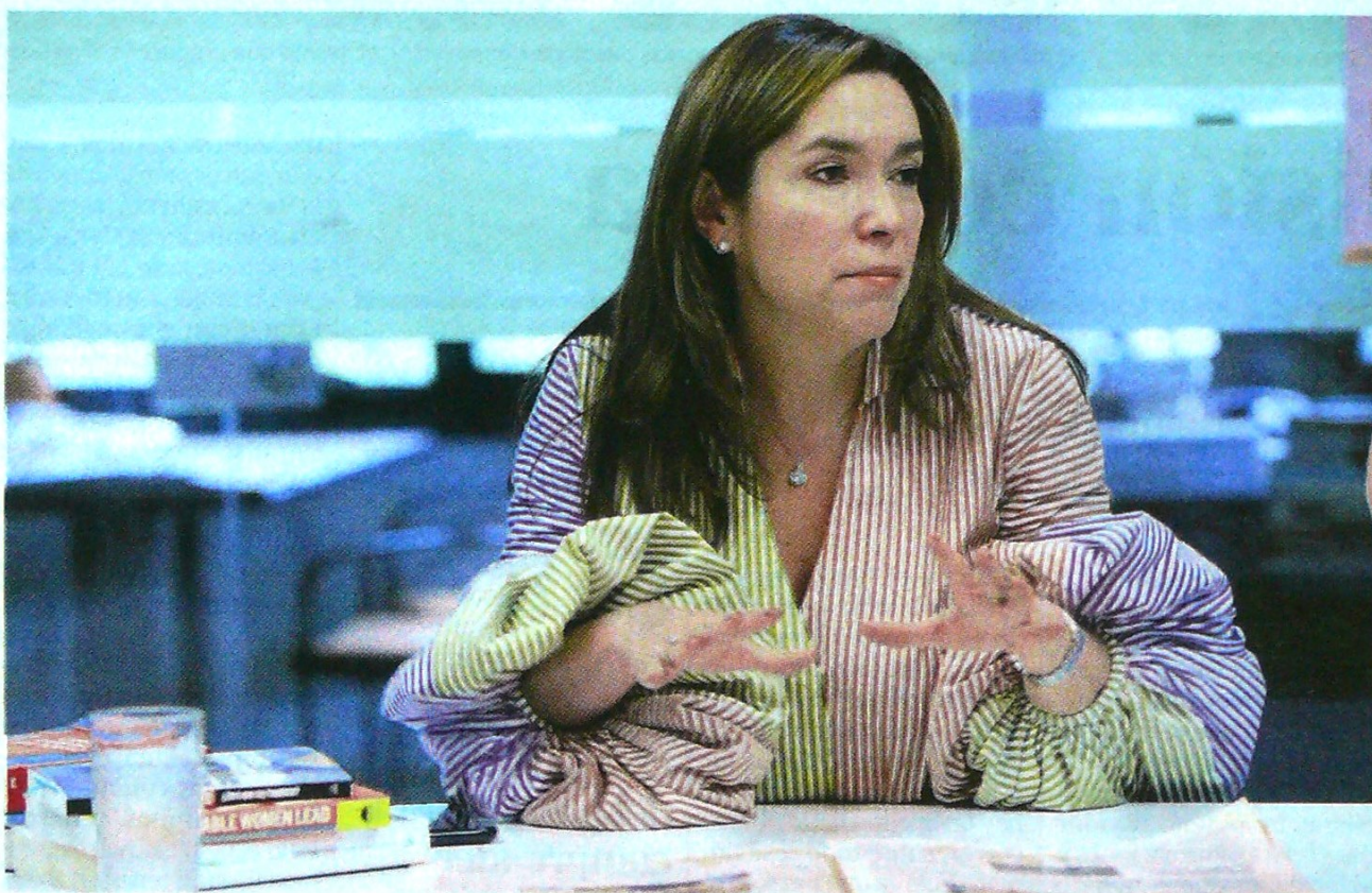
"La equidad de género parte de pensar que somos iguales", María Fernanda Suárez Londoño, ministra de Minas y Energía.

La ministra de Minas y Energía, María Fernanda Suárez, afirmó que las mujeres que ocupan posiciones de mando se destacan por su autenticidad.