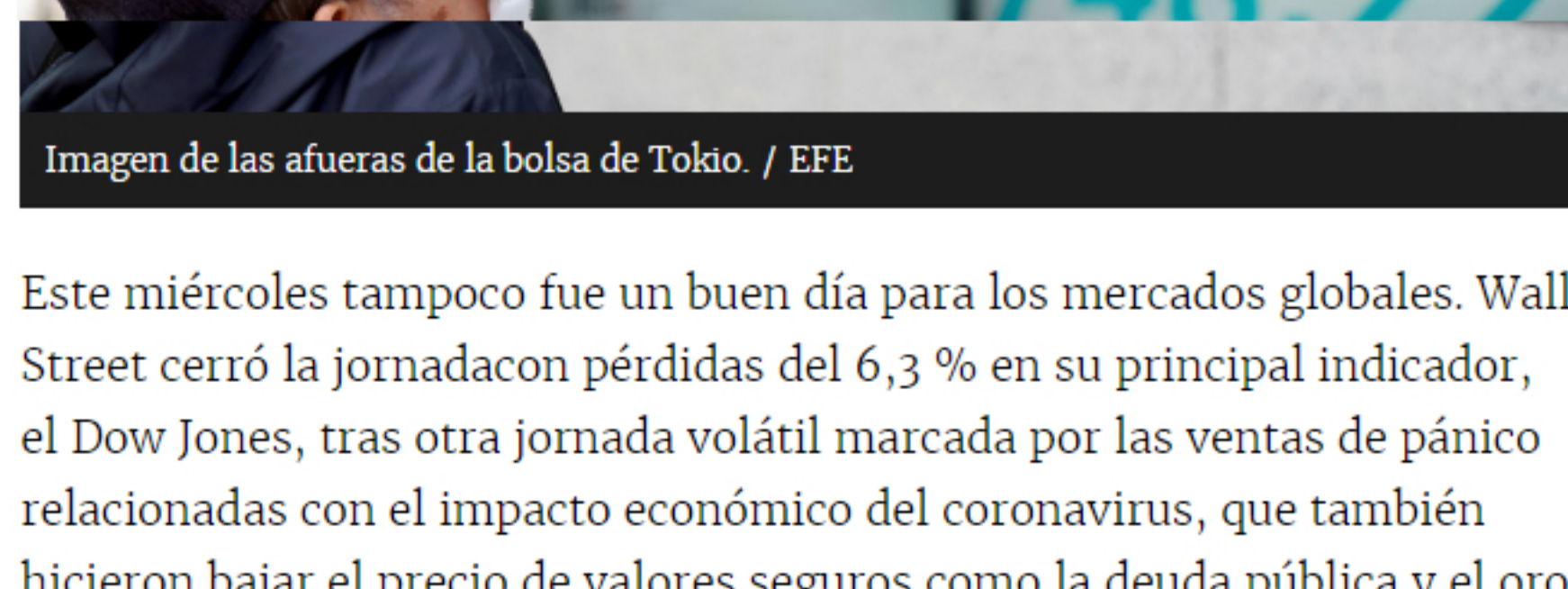
Imagen de las afueras de la bolsa de Tokio

Prácticamente todas las bolsas acumularon pérdidas en las negociaciones del miércoles. En Colombia, el dólar registró un nuevo máximo histórico al llegar a los $4.158. El petróleo continuó hundiéndose.