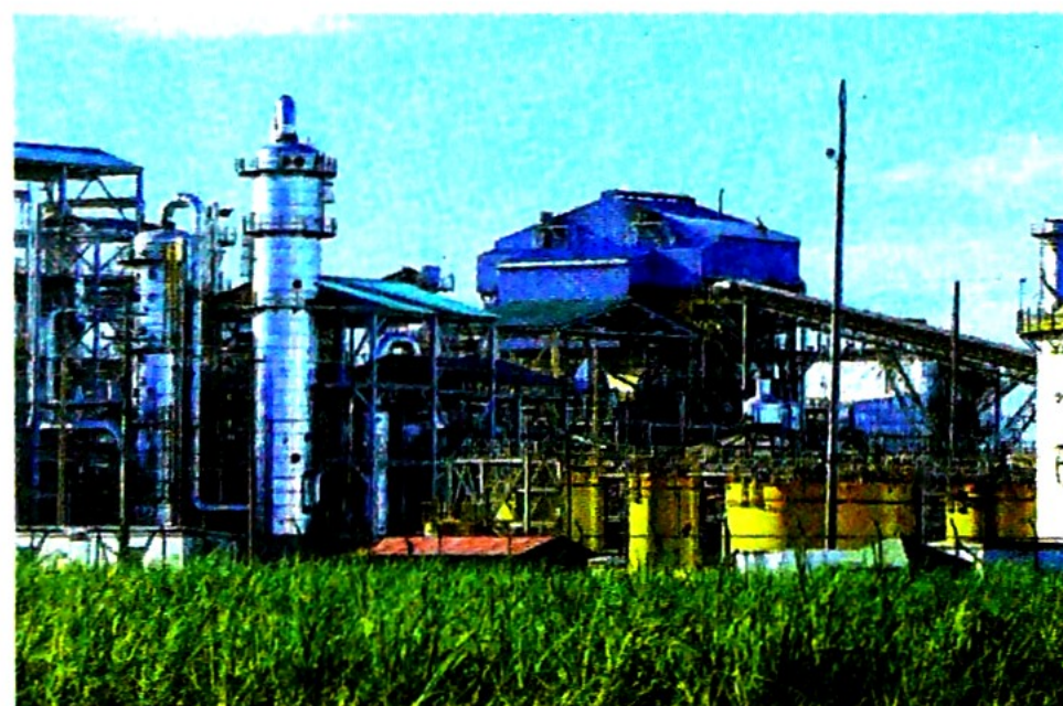
Las firmas deberán dar, en 10 días, la actualización del inventario de activos y pasivos.

expediente 61.670, en esta situación influyeron, entre otros, la edad del cultivo dados los atrasos del proyecto y las condiciones climáticas con una pluviosidad en 2018 y 2019 por un 40 por ciento por encima del pro-