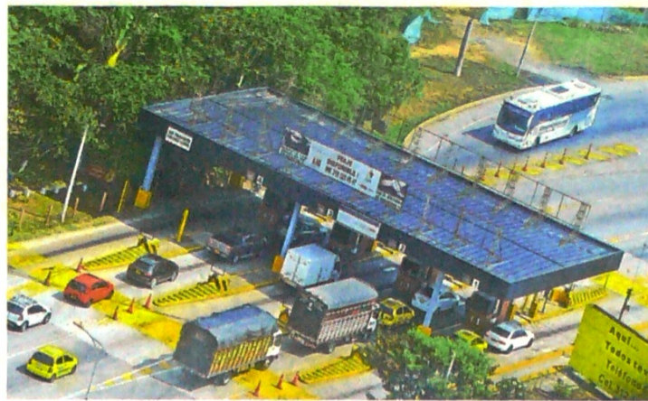
Se espera que el sistema permita que cada carro pase con un único identificador por todos los peajes del país.

En la actualidad, en el país hay 142 peajes nacionales, 99 de ellos en manos de la Agencia Nacional de Infraestructura (ANI) y 43 se encuentran a cargo del Instituto Nacional de Vías (Invias). En las 142 estaciones de peaje del país se recaudan unos 3,5 billones de pesos al año.