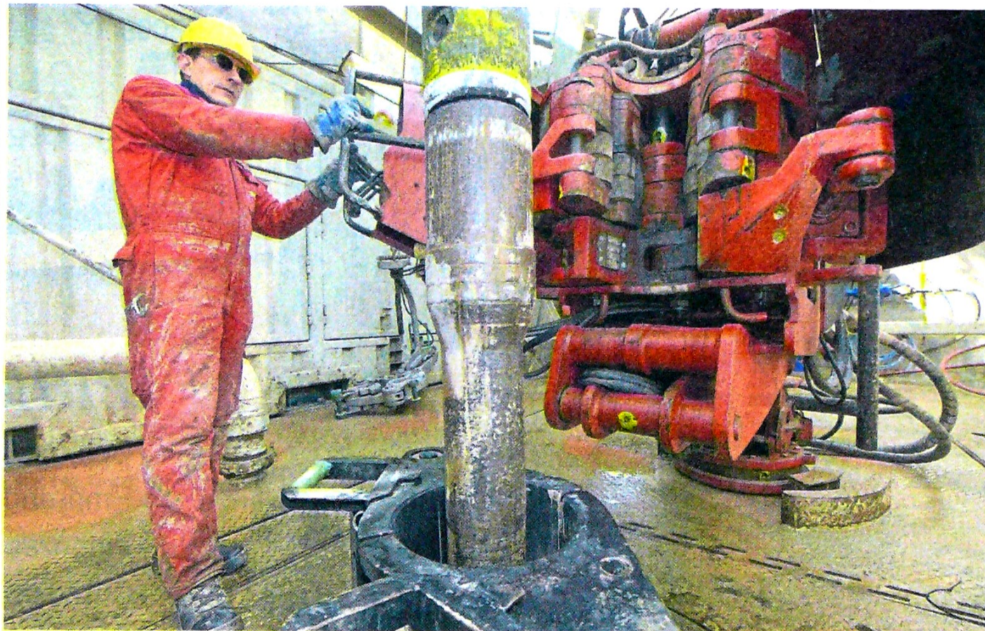
El Certificado (Cert) le da garantías a las empresas petroleras de seguir con las tareas, más en el tema de exploración.

La jefe de la cartera minero-energética subrayó que se debe actuar, pero con cautela, analizando día a día el comportamiento de los precios y viendo cómo