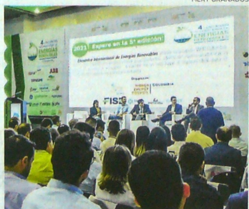
Panel del encuentro de energías renovables.

renovable redoblará los esfuerzos para la creación de empleos en las zonas “donde cuesta crearlos en este momento”.