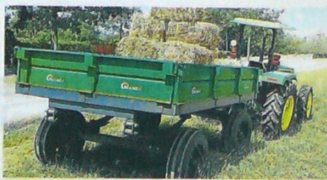
Próximamente se entregarán alimentos bovinos en Bolívar.

se haga la evaluación de la situación y el departamento pueda certificar una situación de calamidad ante el Ministerio de Agricultura.