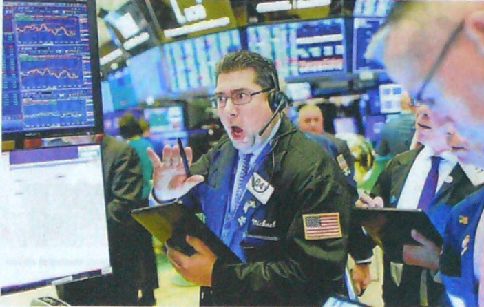
En Wall Street, corredores de bolsa parecían entrar en pánico ante el desplome de algunas acciones.

Según datos de la consultora IHS Markit, se calcula que con motivo de la propagación del virus la demanda de crudo durante el primer trimestre del año sufrirá la ma-