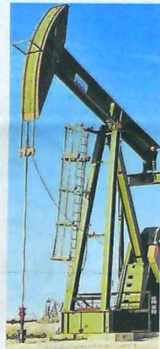
Los miembros de la OPEP no logran consenso sobre cuotas de producción de crudo.

Los afectados deben reportarse ante las Umatas y las secretarías de Agricultura de cada departamento para que