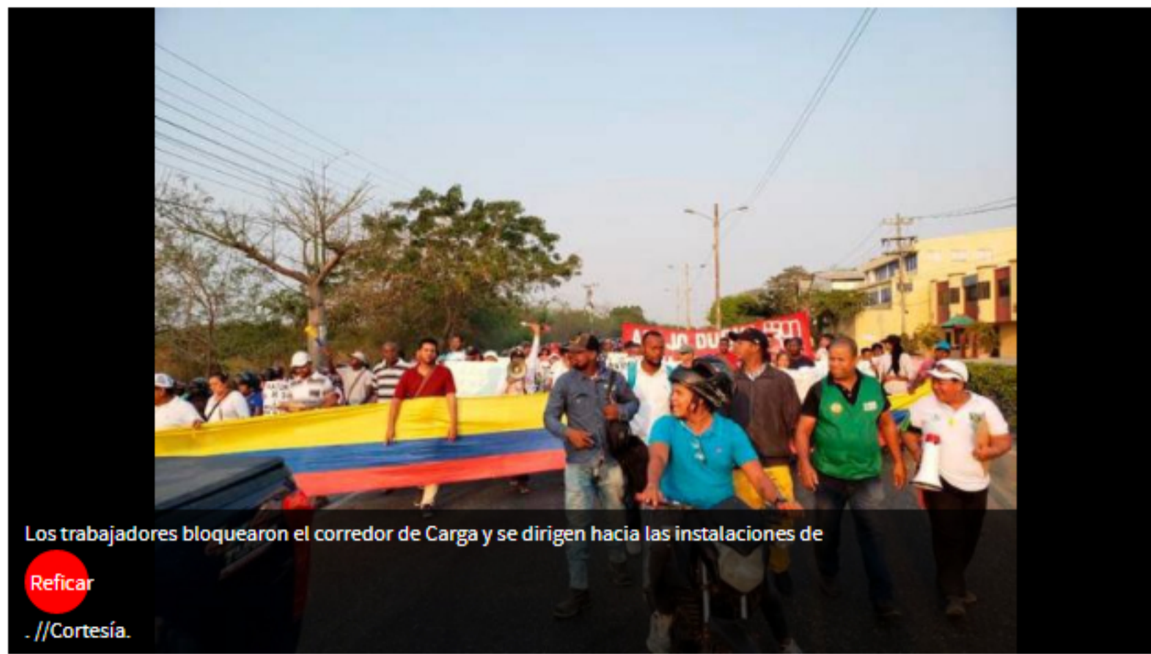
Los trabajadores bloquearon el corredor de Carga y se dirigen hacia las instalaciones de Reficar.

EL UNIVERSAL | @ElUniversalCtg | 09 de marzo de 2020 09:27 AM |