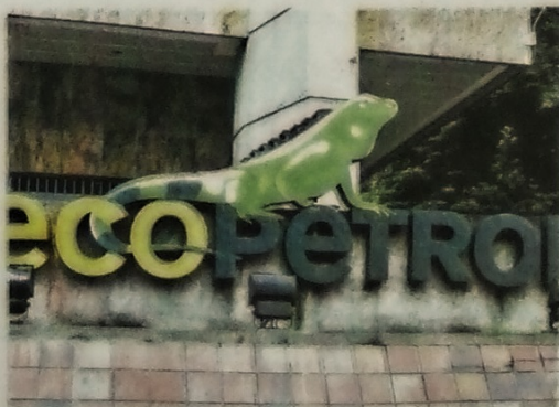
El 2019 fue un año de utilidades récord para la petrolera colombiana, pues obtuvo 13,3 billones de pesos, las más altas en seis años.