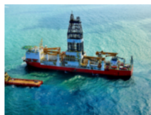
Ecopetrol supera meta de perforación de pozos en 2019 y logra éxito geológico del 40%