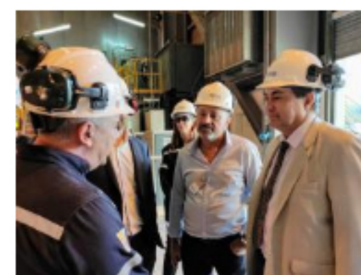
Central térmica Ensenada Barragán expandirá capacidad de generación a 847 MW