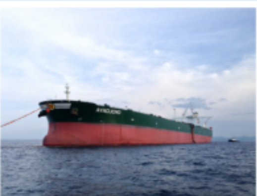
Barril de crudo venezolano se desploma a $40,24