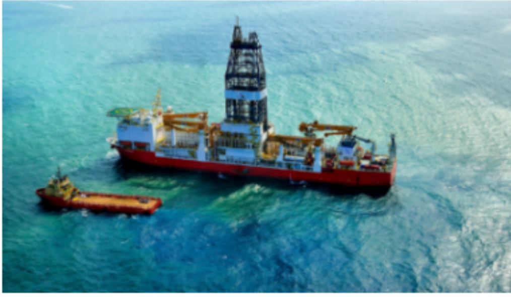
Inversión acumulada del Grupo Ecopetrol en 2019 se incrementó en 51%, concentrándose el 79% en los segmentos de producción y exploración

El informe anual de Ecopetrol 2019 indica que la meta de perforación de 12 pozos prevista para el año fue cumplida en un 167% al lograr perforar 20 pozos, obteniendo una tasa de éxito geológico del 40% por 8 pozos exitosos.