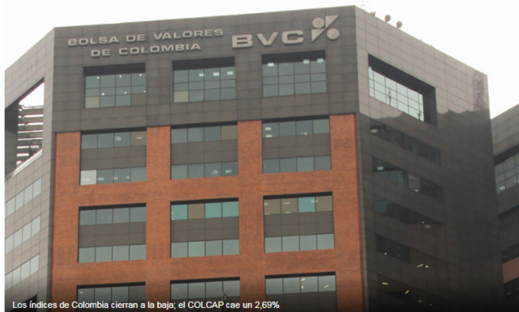
Los índices de Colombia cierran a la baja; el COLCAP cae un 2,69%