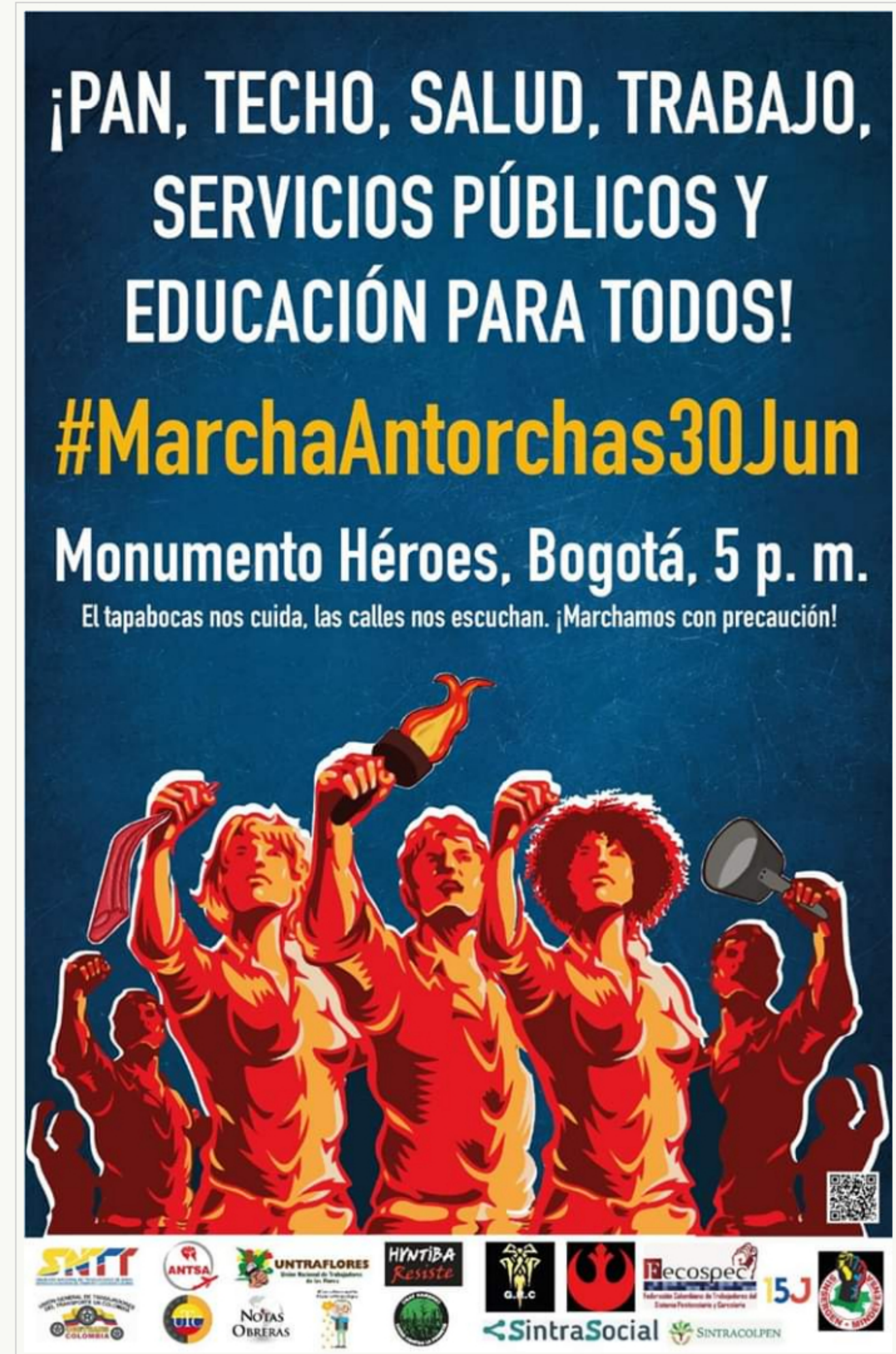
CONVOCAN A MARCHA DE LAS ANTORCHAS EN COLOMBIA

Por: Hernán Durango | Sábado, 27/06/2020 08:04 AM | Versión para imprimir