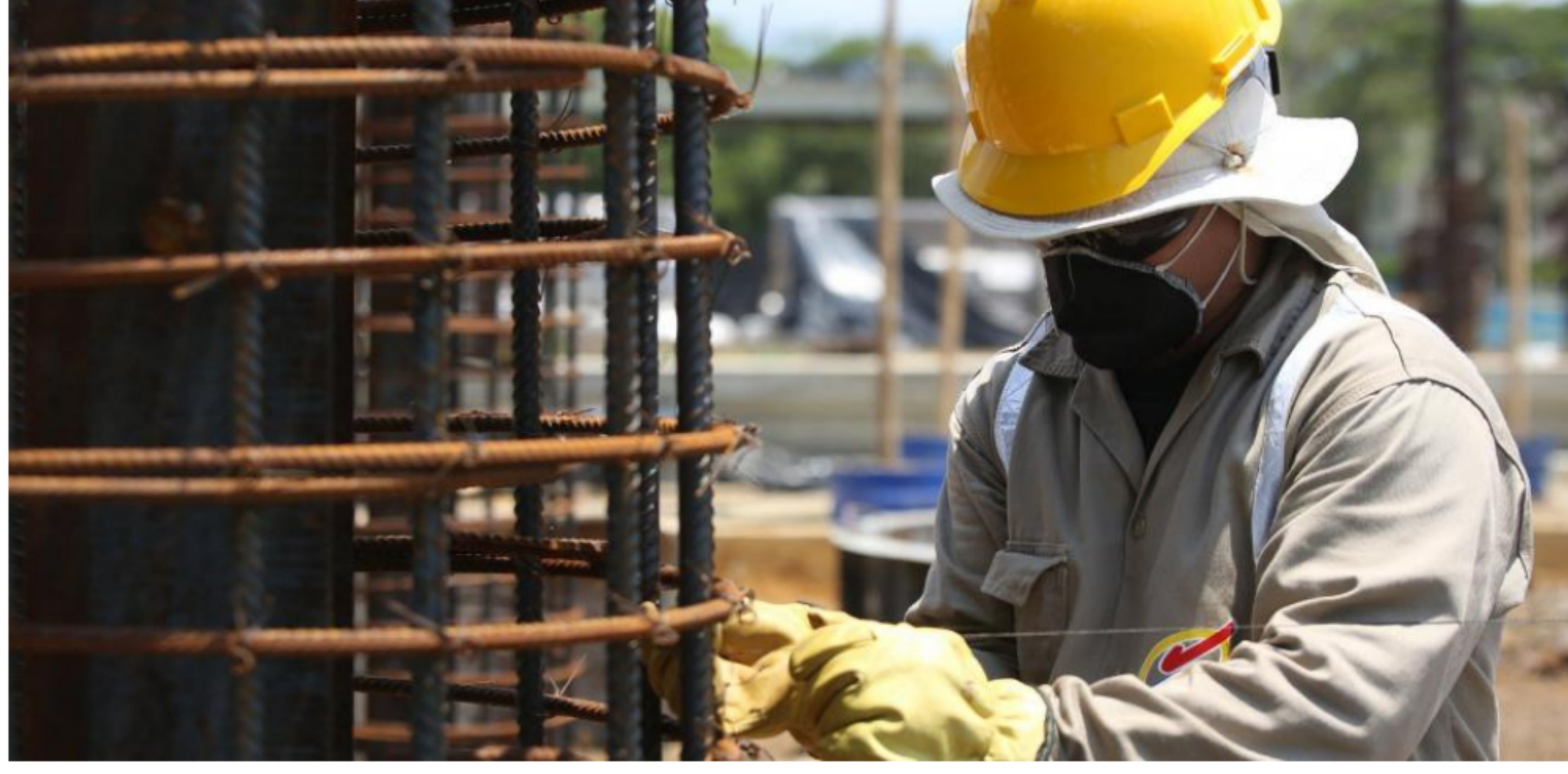
El sector de la construcción fue uno de los primeros en reincorporarse y según análisis de Bancolombia, la destrucción de empleo en el renglón ya habría frenado.

RELACIONADOS: ENERGÍA ELÉCTRICA | MINISTERIO DE COMERCIO, INDUSTRIA Y TURISMO | CONSUMO | PRIMER PLANO | CORONAVIRUS EN COLOMBIA