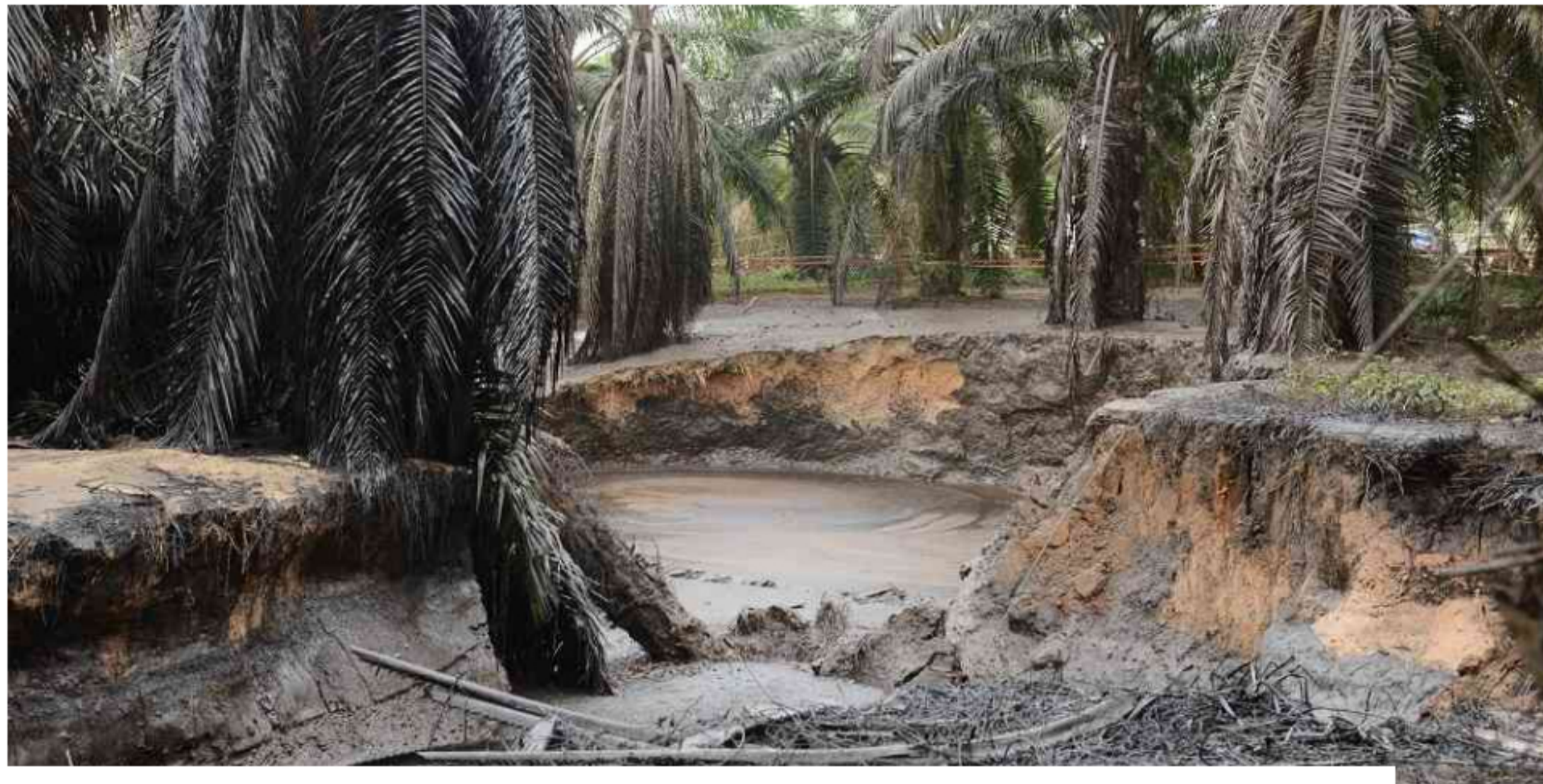
© Ecopetrol activa plan de contingencia por nuevo atentado a Caño Limón Coveñas