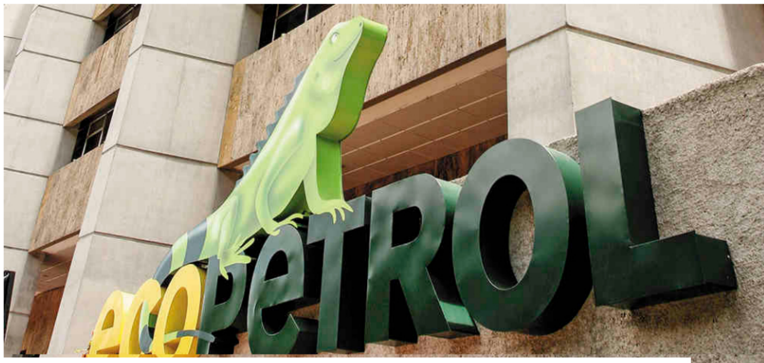
© Oleoductos de Ecopetrol han sufrido 27 atentados en lo que va del 2020 Foto: Guillermo Torres

Los oleoductos de Ecopetrol han sufrido 27 atentados en lo que va del año y este domingo la compañía reportó un nuevo ataque en el Oleoducto Transandino (OTA) en Barbaças (Nariño), razón por la cual tuvo que implementar el plan de contingencia.