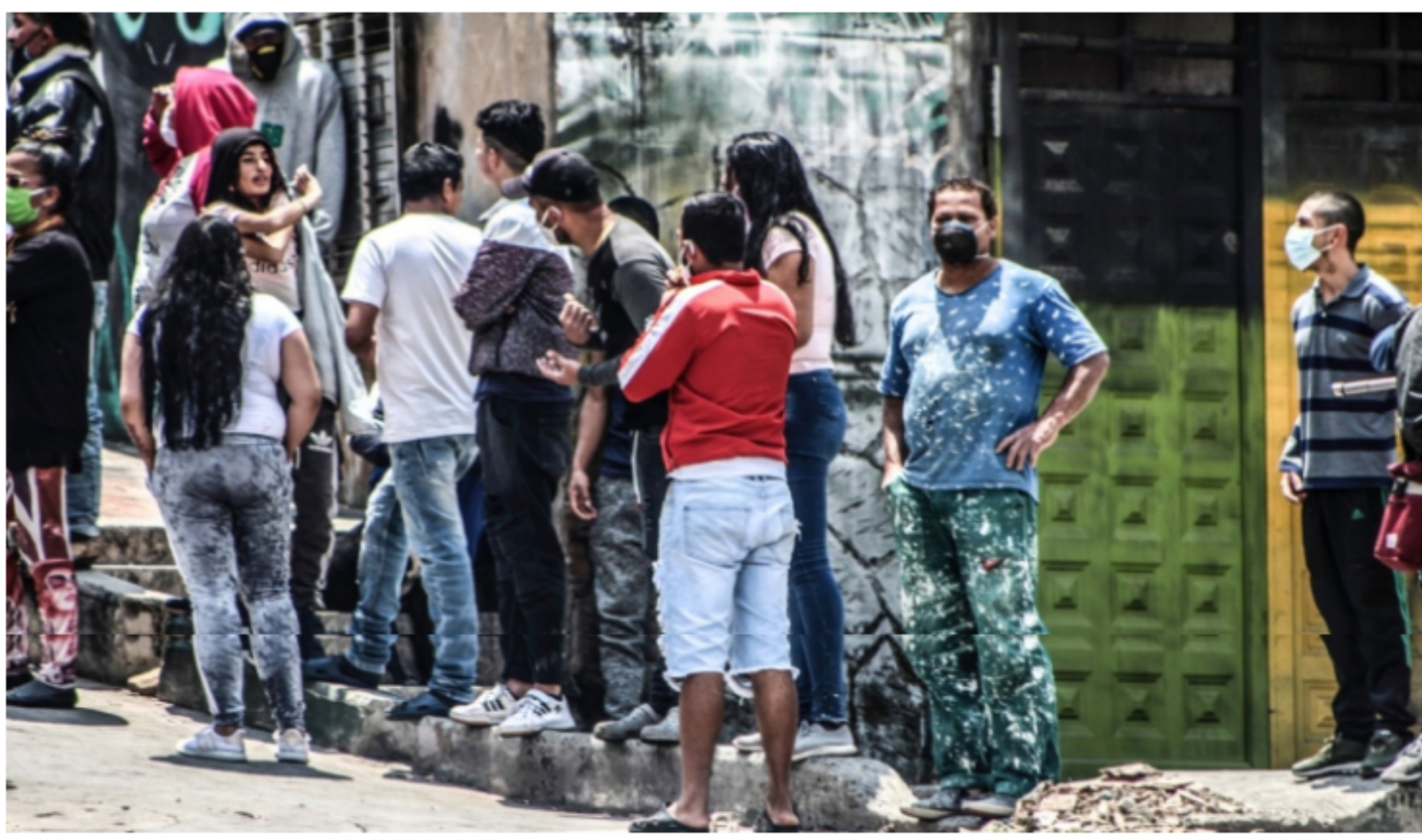
Colombia ha sido con México el país que menos ha gastado para ayudar a la población y a las mipymes: no alcanza a 6 % del PIB

Este es un espacio de expresión libre e independiente que refleja exclusivamente los puntos de vista de los autores y no compromete el pensamiento ni la opinión de Las2Orillas.