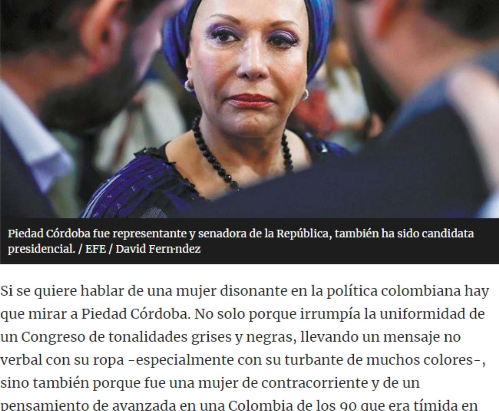
Piedad Córdoba fue representante y senadora de la República, también ha sido candidata presidencial.

Si se quiere hablar de una mujer disonante en la política colombiana hay que mirar a Piedad Córdoba. No solo porque irrumpía la uniformidad de un Congreso de tonalidades grises y negras, llevando un mensaje no verbal con su ropa –especialmente con su turbante de muchos colores–, sino también porque fue una mujer de contracorriente y de un pensamiento de avanzada en una Colombia de los 90 que era tímida en hablar de derechos reproductivos, relaciones homoparentales, negritudes y paz negociada. En los días pasados, la antioqueña dijo públicamente que se retira de la política luego de un 2018 que le trajo más desencantos que certezas. El Espectador habló con la exsenadora sobre lo escarpada que fue su participación en la democracia del país como mujer afro y cómo observa al país en estos momentos. Eso sí, advirtió que su voz no se silenciará.