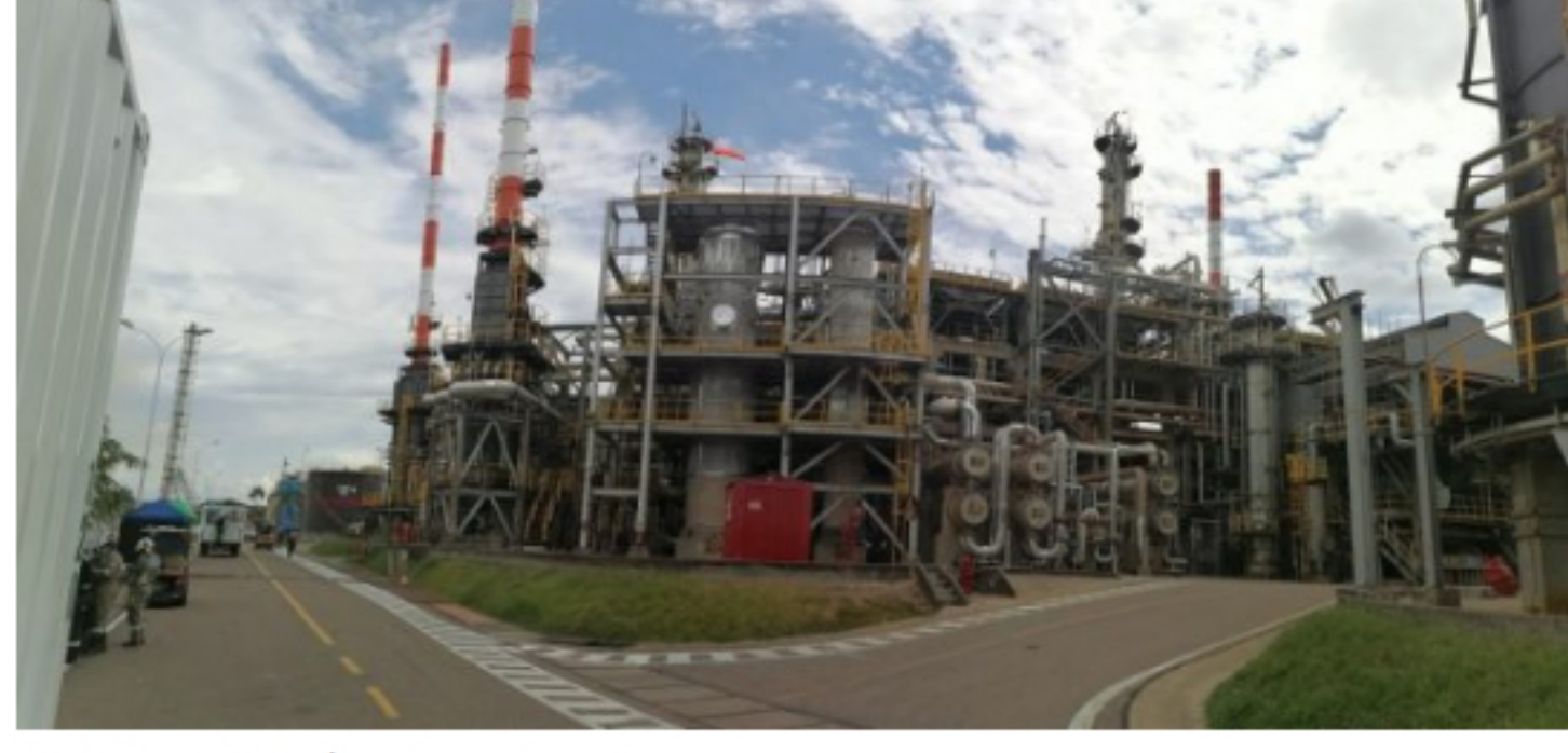
Planta Prime G Refinería de Barrancabermeja

Gracias a estos trabajos y otras obras complementarias que se están llevando a cabo, permitirán a Ecopetrol entregar gasolina de máximo 50 partes por millón de azufre (ppm) en todo el país en 2021, una calidad superior a lo que exige la norma actual, anticipándose a los compromisos adquiridos para mejorar la calidad del aire en todas las ciudades de Colombia.