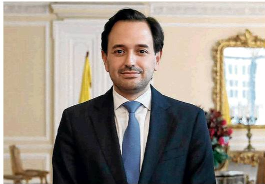
Ministerio de Minas

Diego Mesa , ministro de Minas y Energía , informó que en la tercera semana de julio la producción de petróleo se ubicó en 740.000 barriles al día, lo que significó un alza de 3% respecto a semana anterior. En los primeros 16 días de julio, el promedio de la producción de crudo es de 729.600 barriles al día, manteniendo una tendencia estable respecto a junio. La producción de gas fiscalizado promedio para esta semana es de 1,85 MMPCD, mostrando un aumento del 6% frente a la semana anterior. (AL)