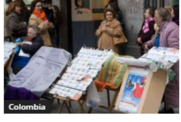
La Lotería de Medellín otorgará subsidios a los loteros antioqueños