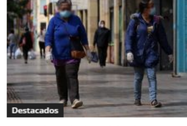
Colombia superó los 100.000 recuperados de coronavirus