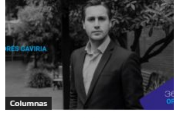
Mejor la federalización