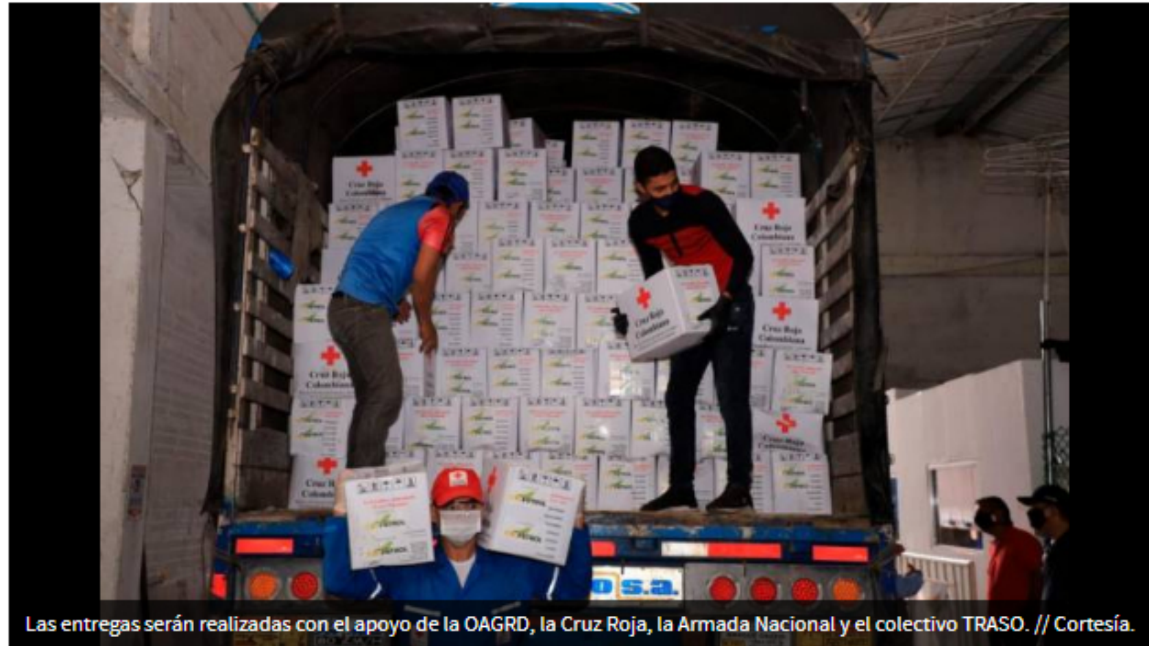
Las entregas serán realizadas con el apoyo de la OAGRD, la Cruz Roja, la Armada Nacional y el colectivo TRASO.

REDACCIÓN CARTAGENA | @EUIUniversalCtg | 17 de julio de 2020 05:06 PM