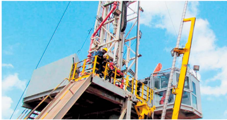
Trabajadores en uno de los pozos de la empresa Hocol, filial de Ecopetrol.

“Los registros e información tomada durante la