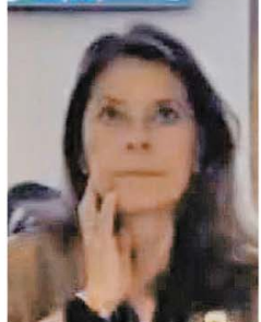
Marta Lucía Ramírez, vicepresidenta de la República.

Según la alta funcionaria, “tenemos que ser capaces de impulsar mujeres empresarias en el sector agro, con proyectos productivos escalables, sostenibles, rentables, que tengan todo el apoyo institucional del gobierno y el acompañamiento de