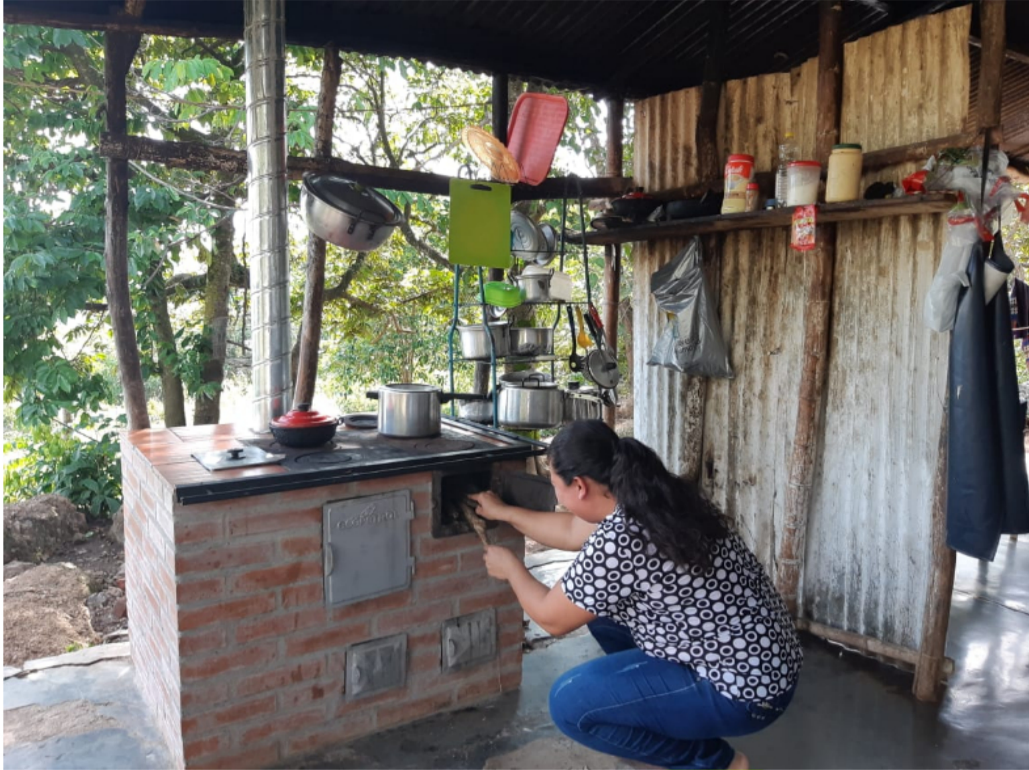
Las estufas ecoeficientes fueron entregadas por la estatal petrolera Ecopetrol .

Además, estas estufas transforman la vida de los hogares, pues reducen en gran medida el riesgo que tienen las familias de contraer enfermedades respiratorias debido a la exposición de gases contaminantes. Los niños y las mujeres son los más expuestos.