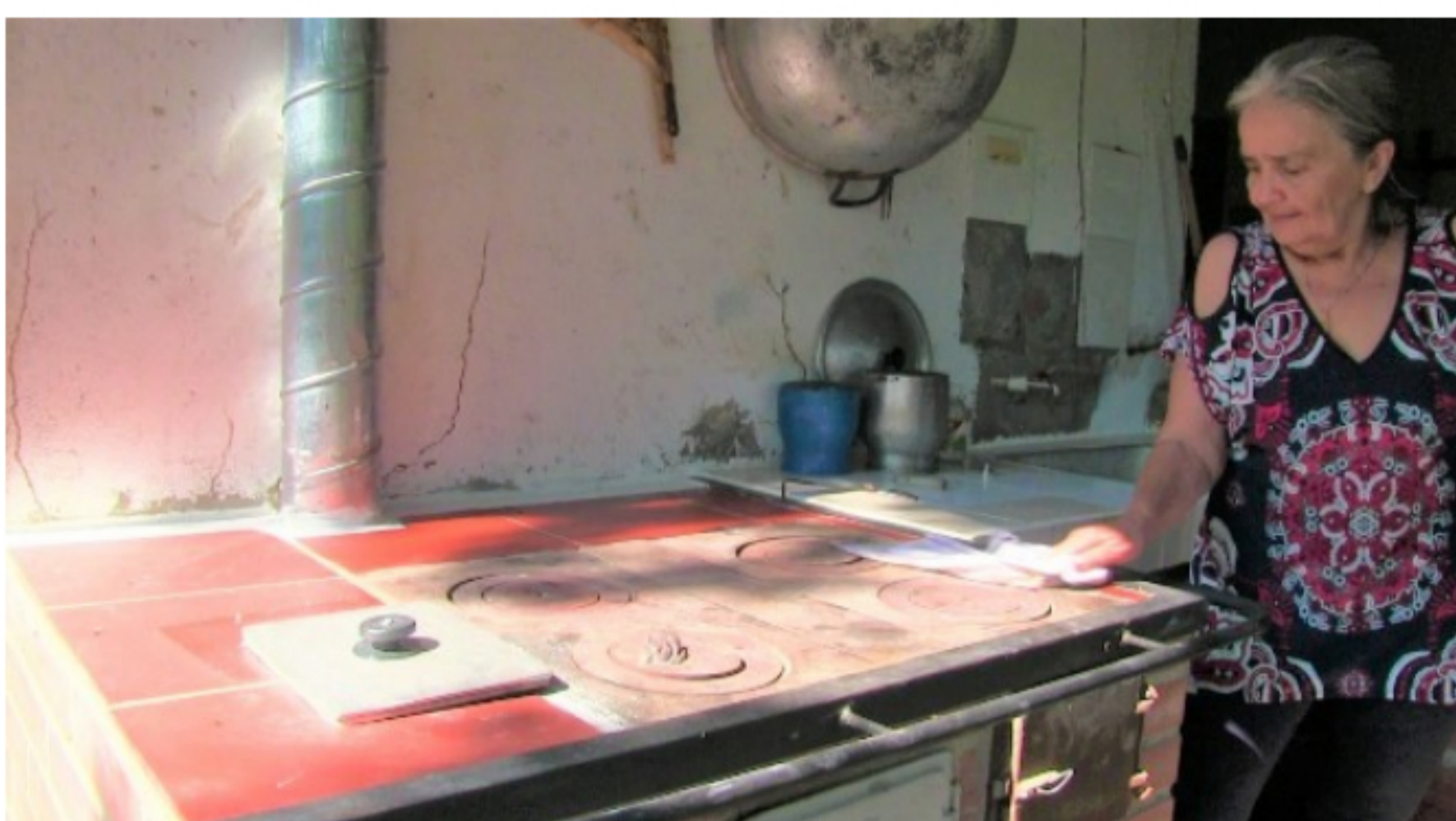
Las familias mostraron su agradecimiento por ser tenidas en cuenta para obtener una estufa ecoeficiente.

Las estufas ecoeficientes consumen hasta un 70 por ciento menos de leña que los fogones tradicionales y conservan mejor el calor obtenido de la combustión, al tiempo que reducen los contaminantes atmosféricos (material particulado, CO2, CO, SO2, NO2) y la deforestación del bosque seco tropical.