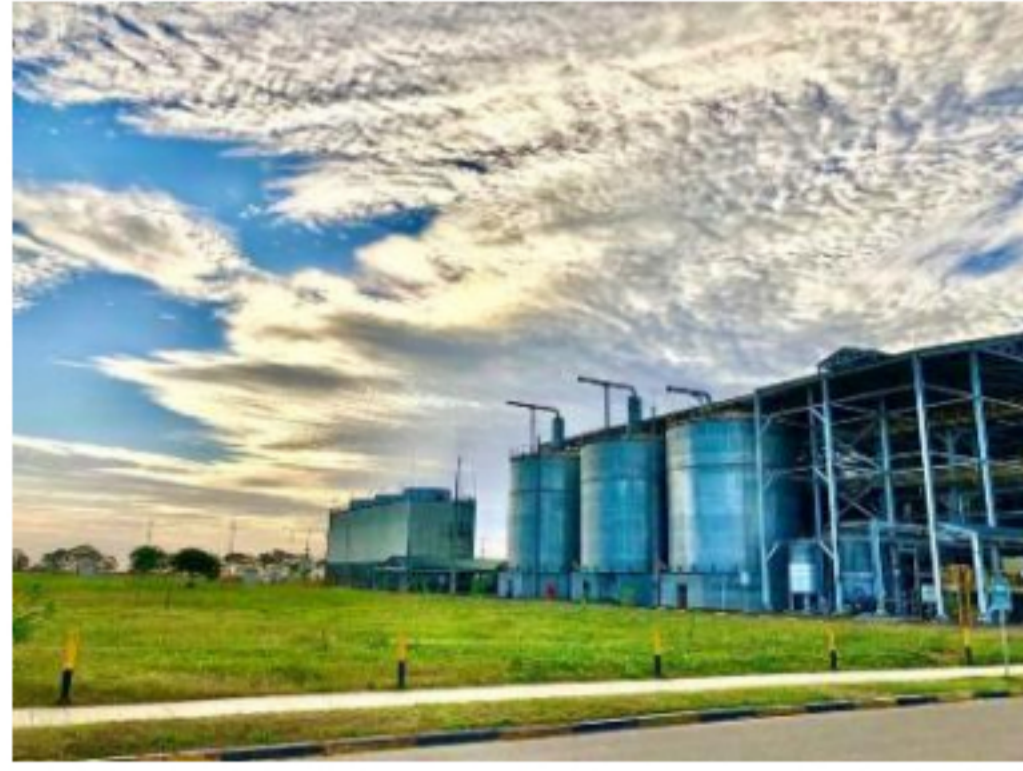
Estados Unidos tiene hoy el 40% del mercado colombiano de etanol, pero la tendencia es al alza

La empresa Bioenergy, uno de los complejos agroindustriales más grandes de Colombia, filial de Ecopetrol ubicada en el departamento del Meta y fuente de empleo de más de 1.500 personas, solicitó ante la Superintendencia de Sociedades iniciar un proceso de liquidación judicial, acción que toma en vista de que tras acogerse a la Ley de Insolvencia Empresarial en marzo de 2020 debido a que no logró llegar a un acuerdo de pago con sus acreedores: Banco de Bogotá, Inversiones Nayomia, Positiva Compañía de Seguros, Inversiones Unidas Páez, Grupo Carranza y Sintrainagro) a quienes les adeuda 400.000 millones de pesos (110 millones de dólares).