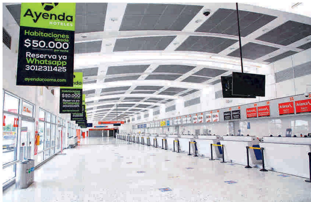
El aeropuerto Palonegro de Bucaramanga está listo para el piloto de apertura de vuelos locales. Édgar Vargas