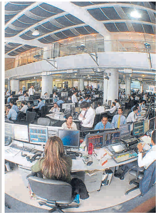
Análisis dice que varios títulos pueden subir fuertemente. CEET

Bancolombia considera que el ajuste económico será lento, pues “hemos tomado un periodo de recuperación de 5 años, luego de los cuales deberíamos llegar a los niveles pre covid-19 en términos de tasa de descuento. Los flujos de caja, de cada compañía, podrían tardarse más o menos tiempo