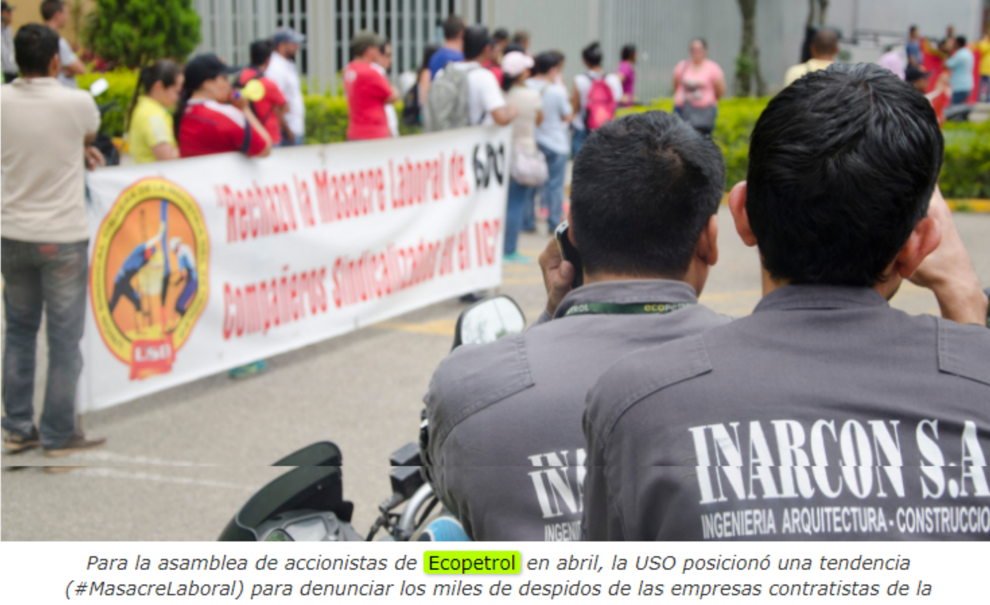
Para la asamblea de accionistas de Ecopetrol en abril, la USO posicionó una tendencia (#MasacreLaboral) para denunciar los miles de despidos de las empresas contratistas de la estatal aprovechando la crisis.

Este es un espacio de expresión libre e independiente que refleja exclusivamente los puntos de vista de los autores y no compromete el pensamiento ni la opinión de Las2Orillas.