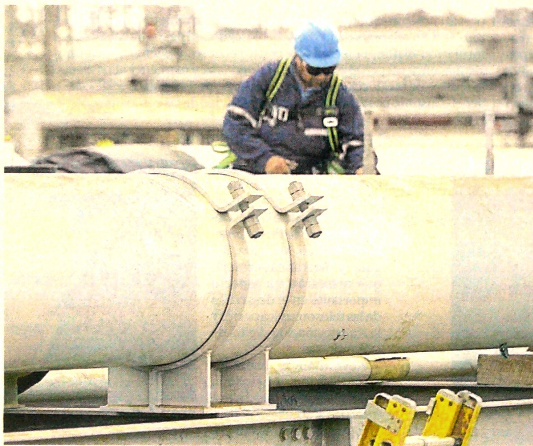
La empresa Promigas adquirió el 100% de la firma Gas Comprimido del Perú (Gascop).

La fuente consultada subrayó que con la citada adquisición Promigas “continúa su estrategia de expansión en el vecino país, con-