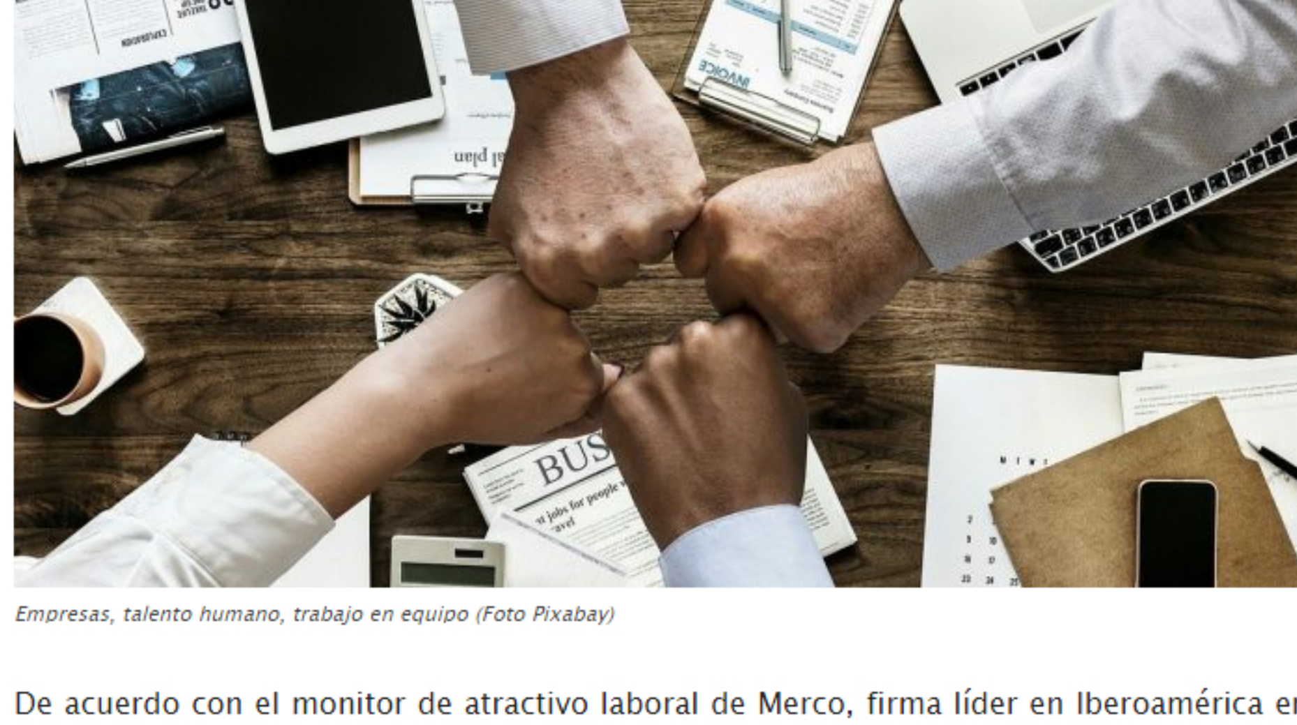
Empresas, talento humano, trabajo en equipo

De acuerdo con el monitor de atractivo laboral de Merco, firma líder en Iberoamérica en medición de reputación corporativa, en Colombia las empresas con el mejor talento son: