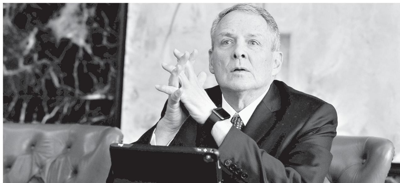
Juan José Echavarría, gerente del Banco de la República, que bajó por cuarto mes consecutivo las tasas de intervención.

Dijo que el balance de riesgo sugiere seguir estimulando la economía y reveló que cinco miembros de la junta aprobaron la disminución finalmente acordada y dos consideraron que debió ser de 50 puntos básicos, o medio punto por-