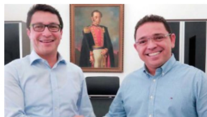
30 junio, 2020 27 congresistas de las bancadas de oposición respaldan a gobernador Carlos Caicedo y exalcalde Rafael Martínez