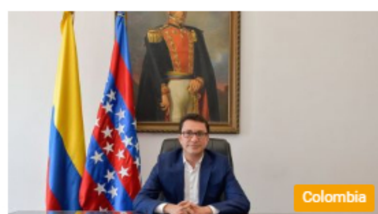
La realidad de los bienes del gobernador Carlos Caicedo 30 junio, 2020