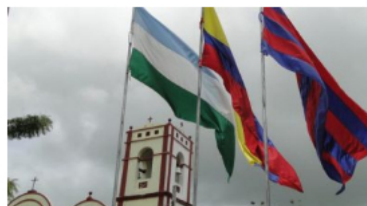
30 junio, 2020 Sexto comité de seguimiento electoral con avance para las elecciones atípicas de San Zenón