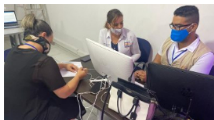
30 junio, 2020 Estrategia GSI genera nueva dinámica de seguridad en Santa Marta