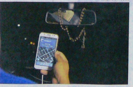
Uber se despidió de Barranquilla el 16 de enero.

sobre la situación de la empresa Uber en Colombia y en el mundo. "Nos dimos cuenta que aquí en Colombia están incurriendo en dos actos: obtener una ventaja competitiva significativa a través de una violación de una norma, en este caso, las normas de transporte, y por esto mismo, el desvío de la clientela", dijo Aviar. Uber, por su parte, se defiende argumentando que