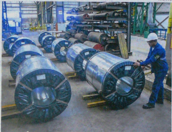
Trabajador de una empresa del sector metalmeccánico de Barranquilla.