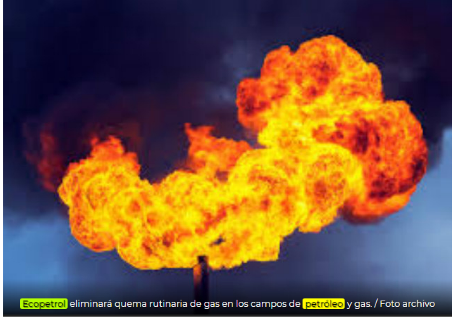
Ecopetrol eliminará quema rutinaria de gas en los campos de petróleo y gas. / Foto archivo

Ecopetrol informa que adhirió a la iniciativa del Banco Mundial (BM) denominada 'Zero Routine Flaring by 2030' , la cual tiene como meta eliminar la quema rutinaria de gas en los campos de petróleo y gas lo antes posible, y a más tardar 2030.