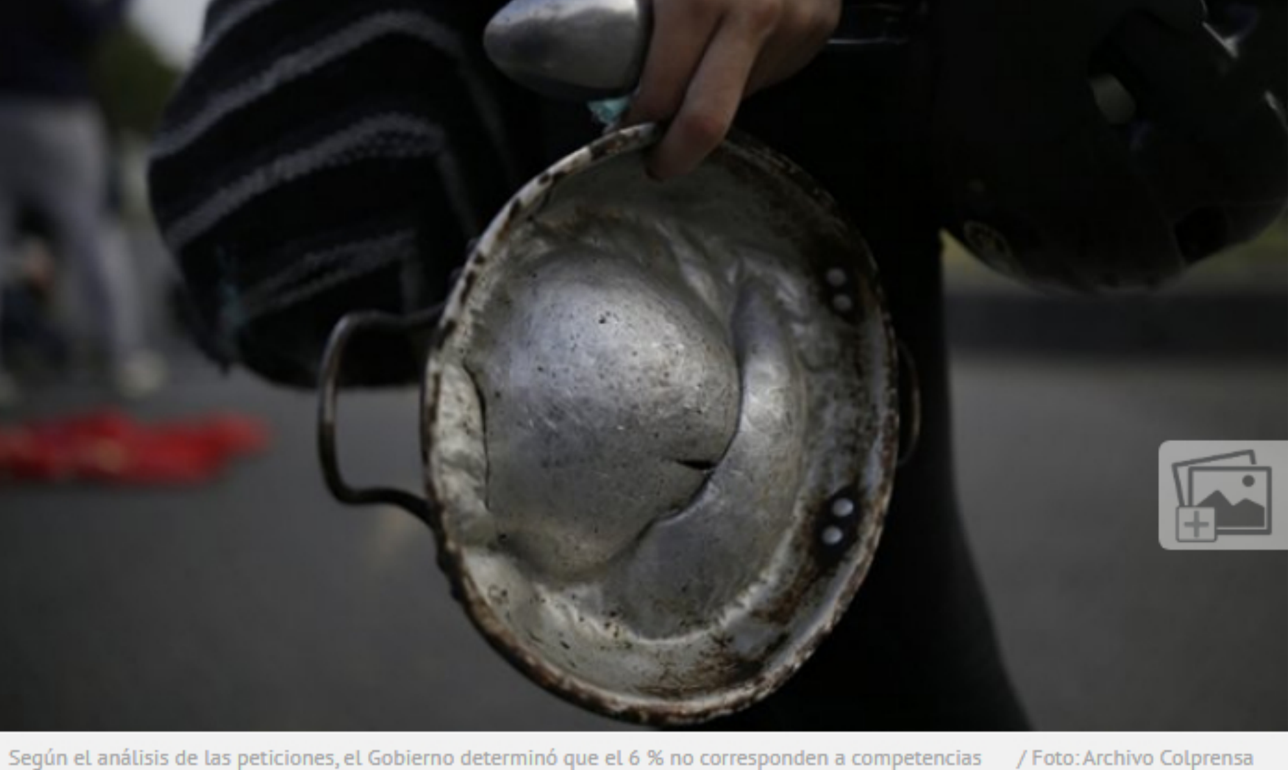
Según el análisis de las peticiones, el Gobierno determinó que el 6 % no corresponden a competencias del Ejecutivo.

2 mil personas aproximadamente se reunirán en el teatro Jorge Eliécer Gaitán de Bogotá.