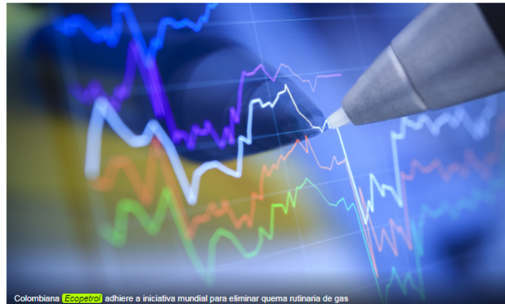
Colombiana Ecopetrol adhiere a iniciativa mundial para eliminar quema rutinaria de gas

BOGOTÁ, 30 ene (Reuters) - La petrolera colombiana Ecopetrol ECO.CN se unió a una iniciativa global liderada por el Banco Mundial para eliminar la quema rutinaria de gas en sus operaciones, informó el jueves la compañía.