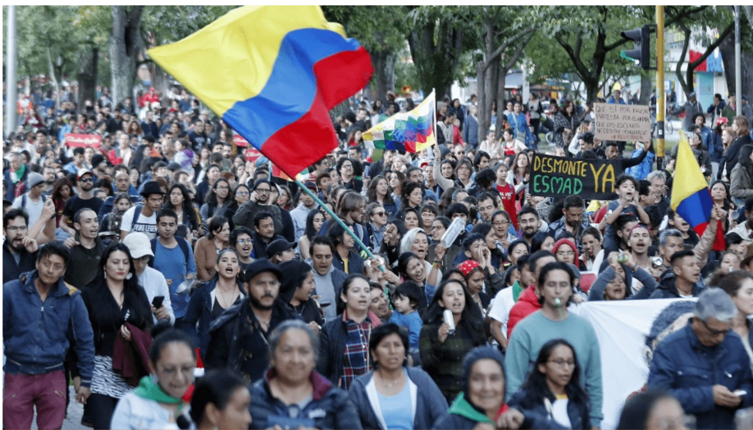
El cacerolazo, uno de los símbolos de estas protestas, es una práctica recurrente en América Latina que, de acuerdo con los expertos, Colombia adoptó en estas movilizaciones. Foto: Manuel Saldarriaga Quintero Foto: Cortesía.

Cerca de dos mil personas las que se darán cita en el teatro Jorge Eliécer Gaitán de Bogotá, para definir también la fecha de la nueva jornada de paro nacional