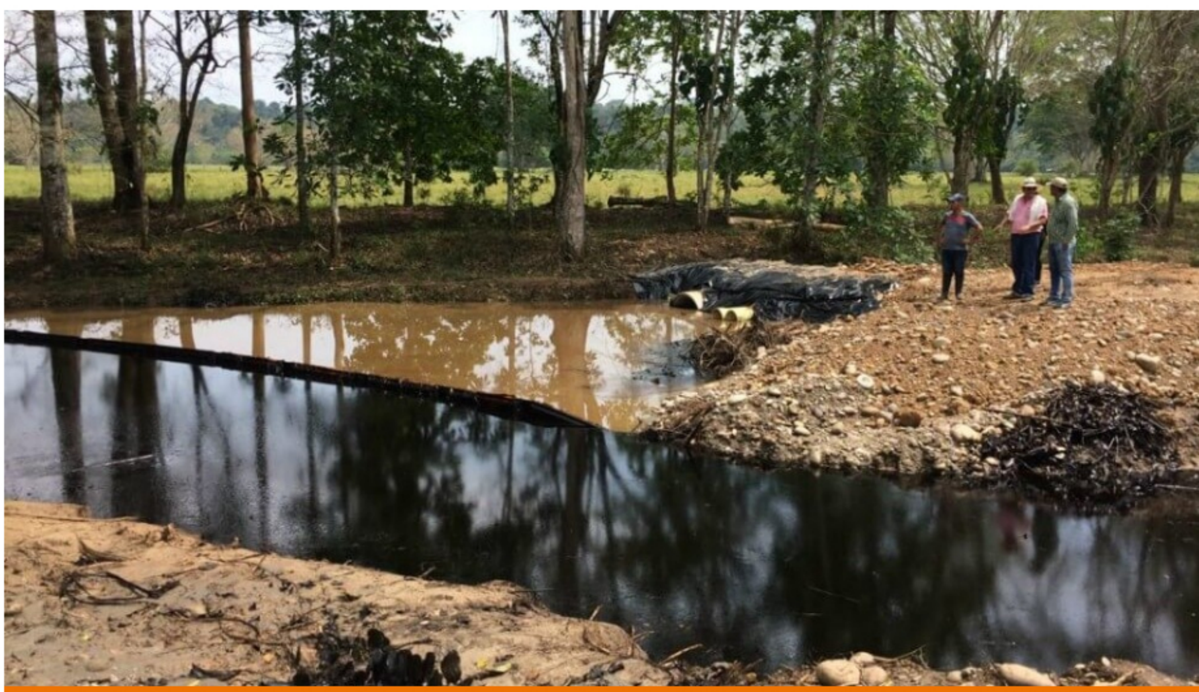
Con este, ya sería el quinto miembro de las Farc asesinado en el primer mes de 2020.

La multa recae tras el derrame de crudo en Lizama, Santander en marzo del 2018