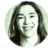
María Fernanda Suárez Ministra de Minas y Energía

FOCOS ESTRATÉGICOS FUERON CON LOS QUE TRABAJARON LOS EXPERTOS DE LA MISIÓN. SE ANALIZÓ EL ROL DEL GAS.