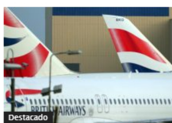
Destacado Más de 20 grandes aerolíneas mundiales han anunciado cancelación o suspensión de vuelos a China por coronavirus