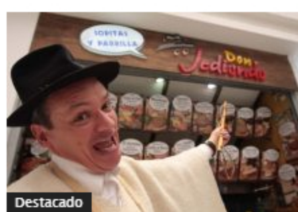
Destacado Restaurantes de Don Jediondo están en crisis financiera y preparan cierres en Bogotá, Cartagena y Santa Marta