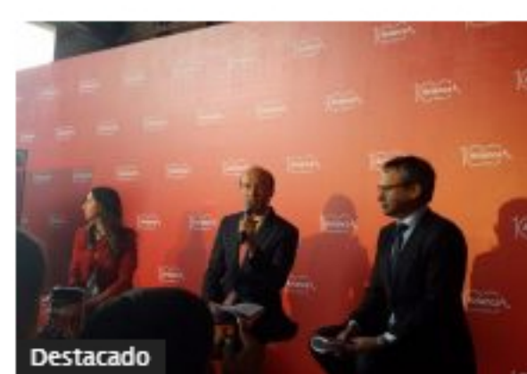
Destacado Avianca celebra sus 100 años con nuevas rutas y planes en hubs de Bogotá y San Salvador