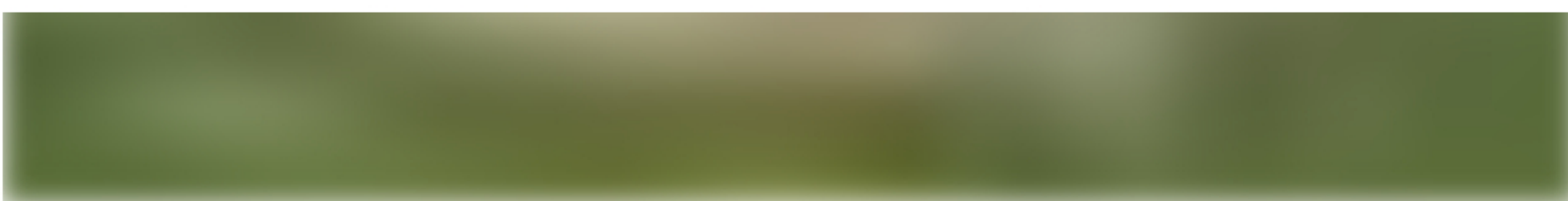
La deforestación es uno de los principales motores para que se generen gases efecto invernadero en Colombia.

El país emite al año un promedio de 237 millones de toneladas de gas carbónico a la atmósfera. Las actividades en tierras forestales, incluida la tala de árboles, representan el 33% de la generación. Hoy, en el Día Mundial por la Reducción de las Emisiones de CO2, les contamos cuáles son los sectores y departamentos que más emiten.